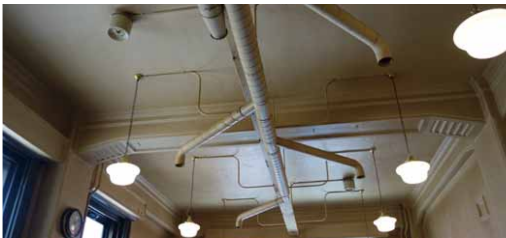
ダクトと配線の妙