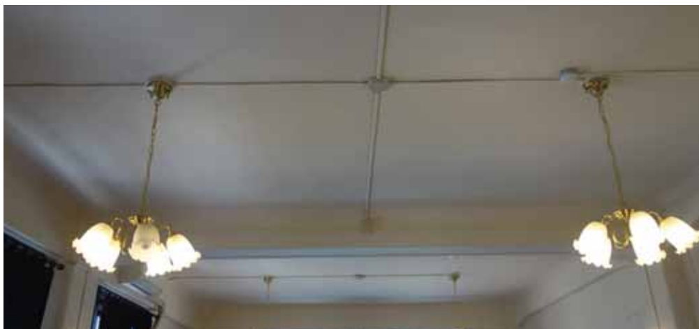
個室のシャンデリア