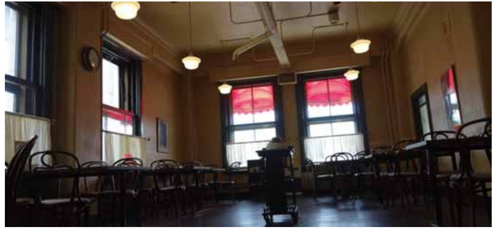
映画に出てきそうな空間