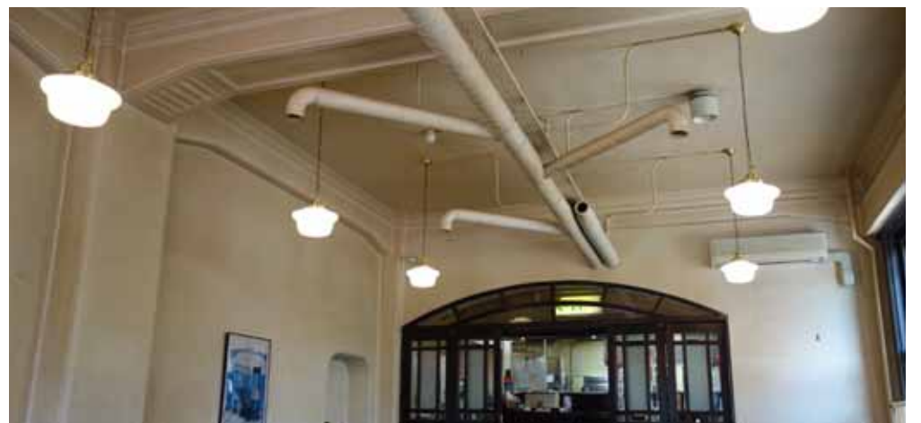
ダクトと配線が天井に露出. しても自然