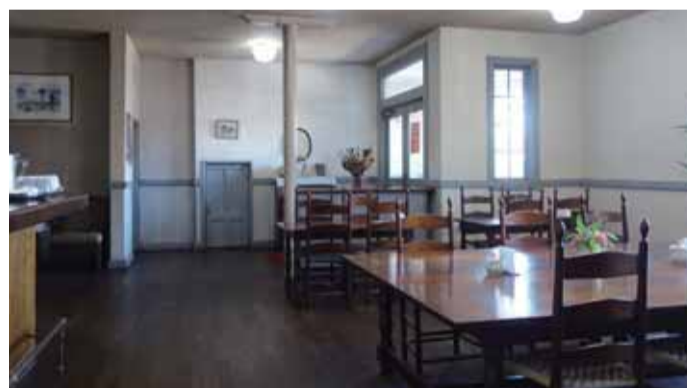
アーリーアメリカンのイスとテーブル