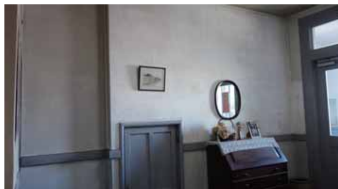
漆喰壁のアプローチ