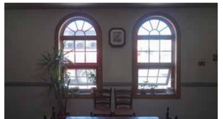
ファンタジーな窓灯り