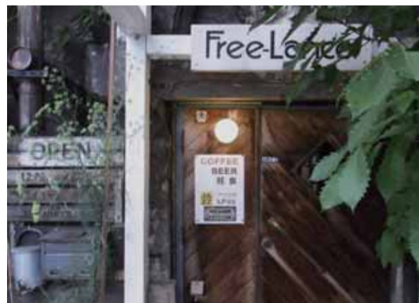
どうぞお入りください