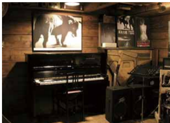
マイクなしでいい音で鳴ります