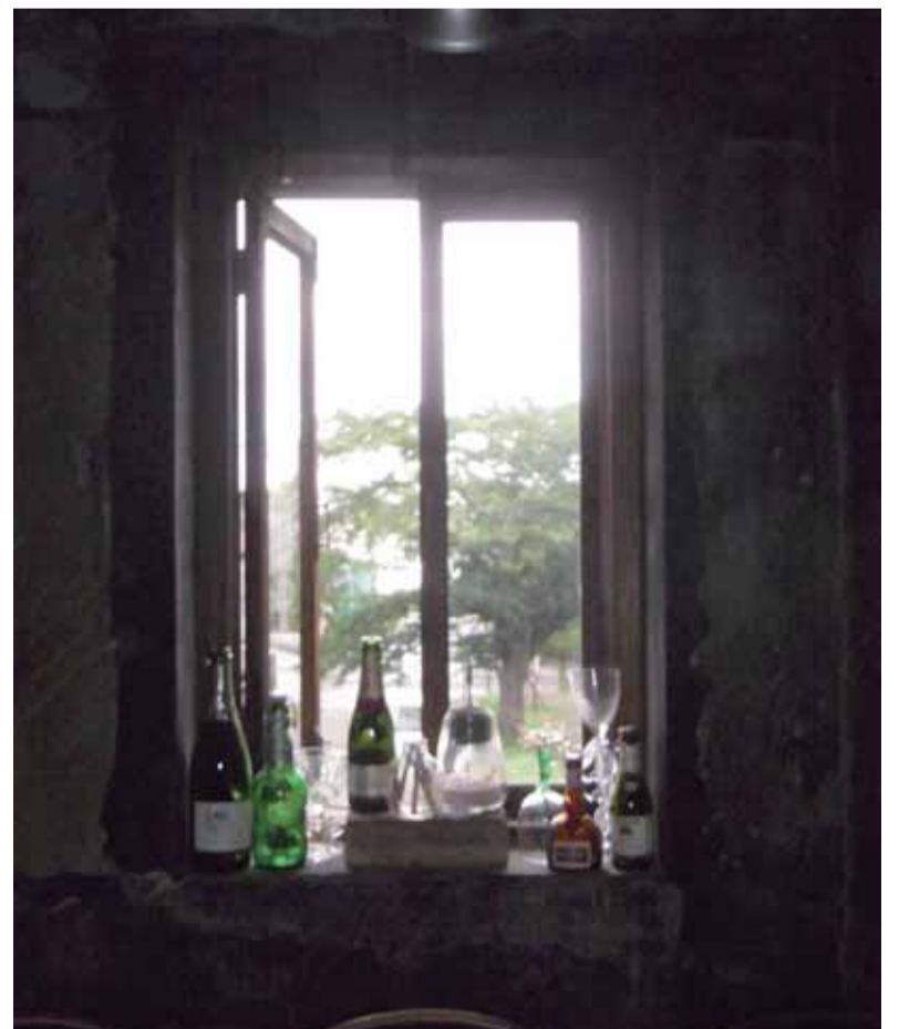
視線の先に海が見えます