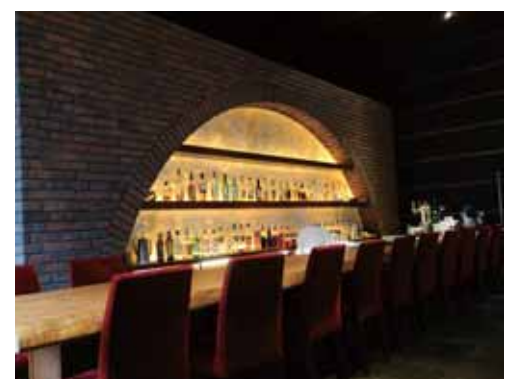
お洒落なカフェカウンター