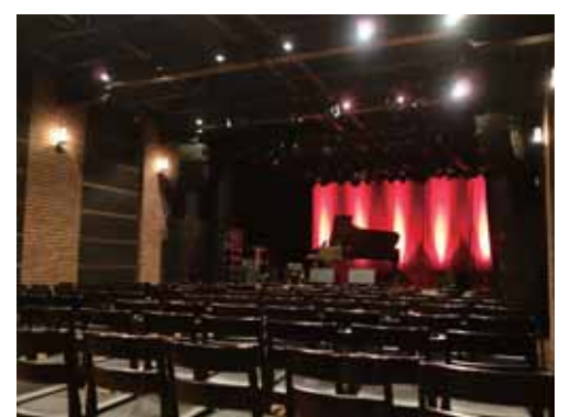
音響抜群のホール