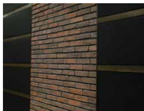
遮音と吸音の壁造作