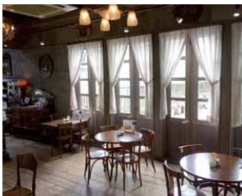
カフェの雰囲気も和む