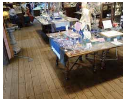
床材の素朴さが見事