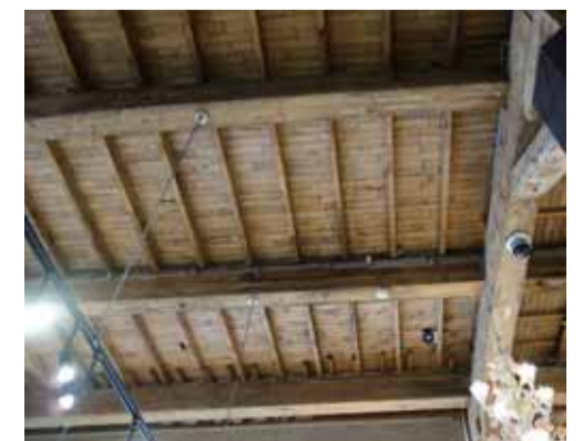
吹き抜けの梁と天井