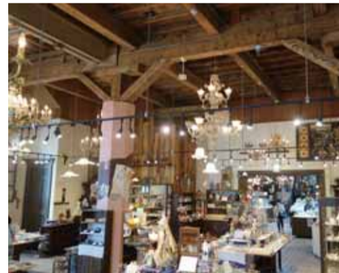
商品内容と天井空間が小樽的