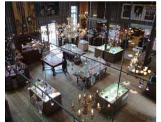
新館の店内も違和感がない