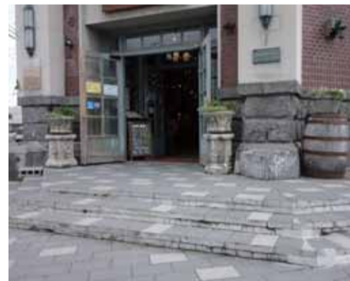
エントランス石段が重厚