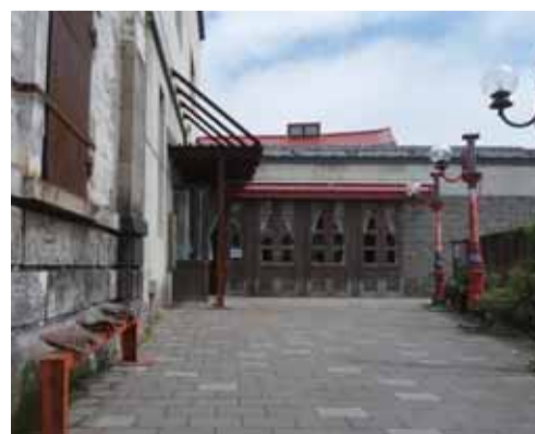
カフェへのアプローチもエキゾチック