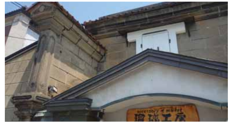
商人権威のうだつ