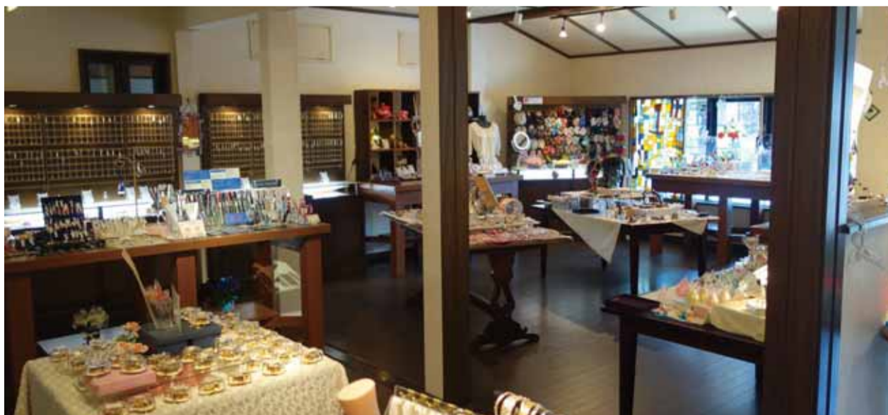
アクセサリが映える空間