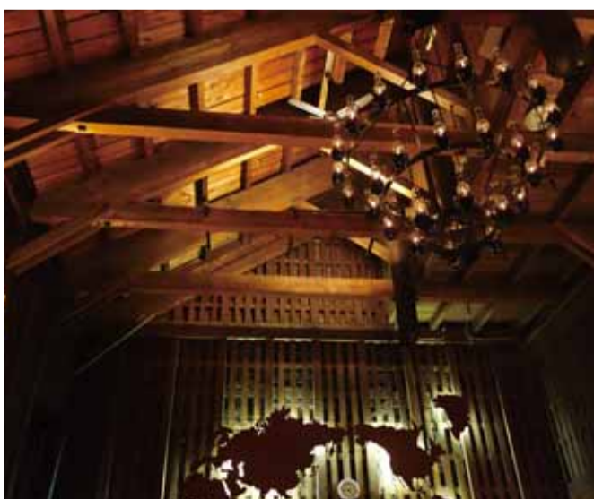
梁を生かしランプをシャンデリアに