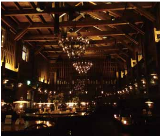
小樽ファンタジックの代名詞

ガラス製品は、手作り感覚を大切にしており、1つ1つ微妙に形が違っていたり風合いが微妙に異なる。基本的に通販はしていない。小樽に来なければ購入できないのが北一硝子の商品。