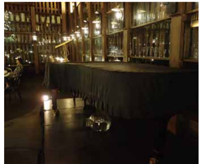
コンサートの臨場感は独特