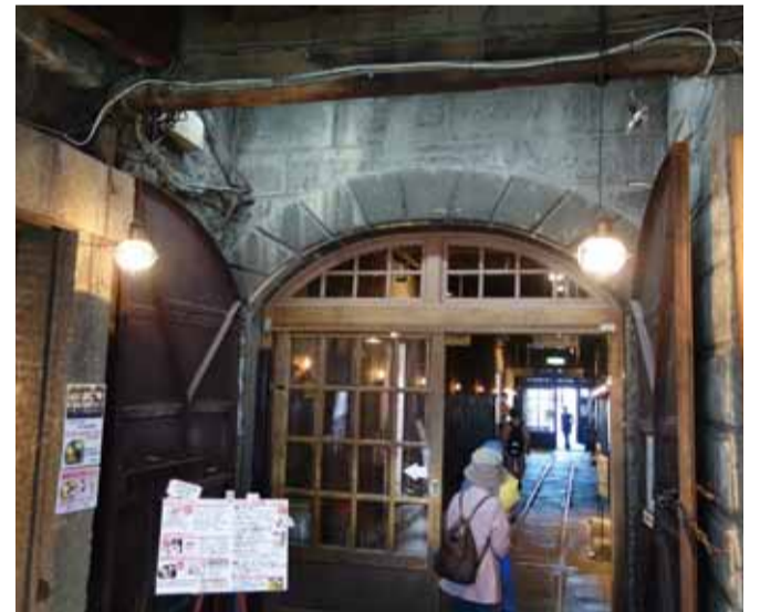
重層感際立つアーチ