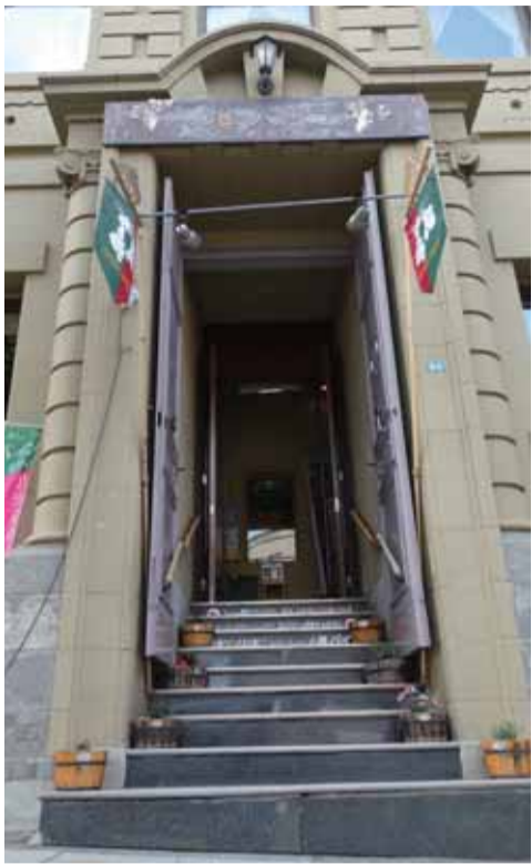
玄関周りの石積み