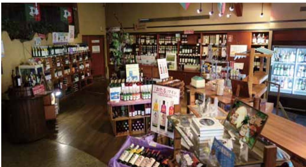
ワインショップ店内