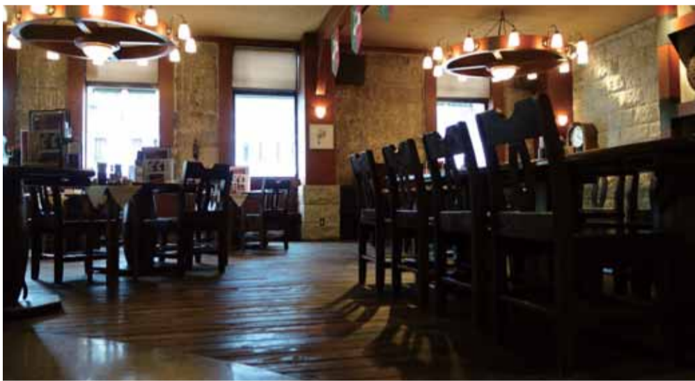
壁・腰壁・敷石の石材コーディネート