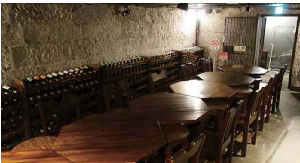
旧金庫室がワインセラーに