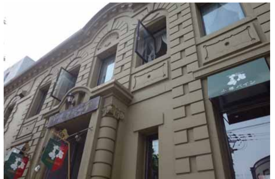
イタリアのルネサンス様式彫刻