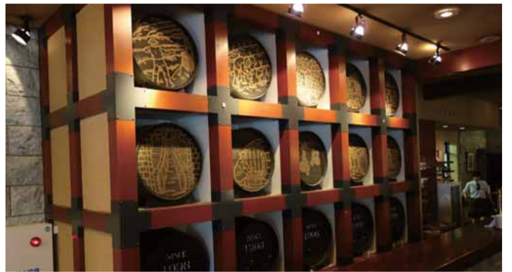
ワイン樽のディスプレイ