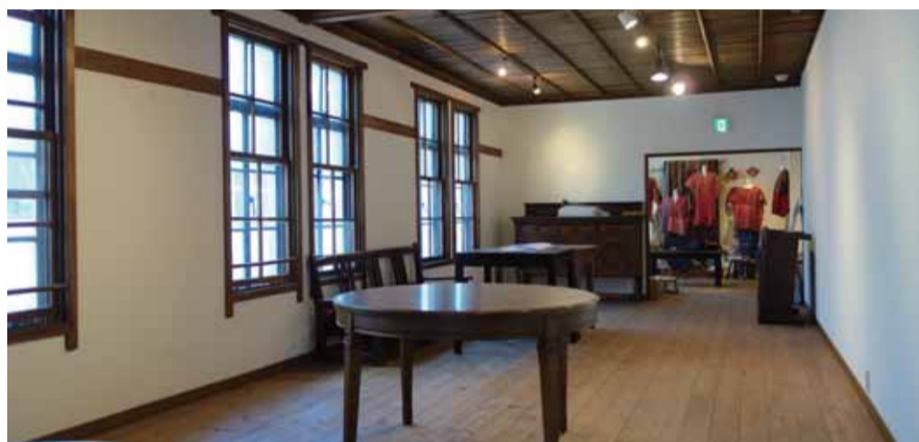
2階ギャラリースペース