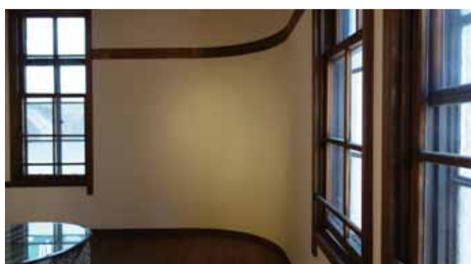
洗練されたアール構造