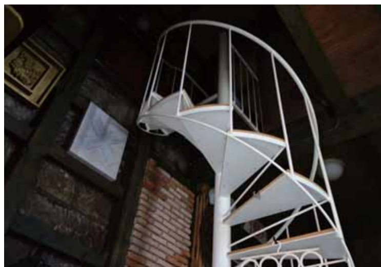
異空間への螺旋階段