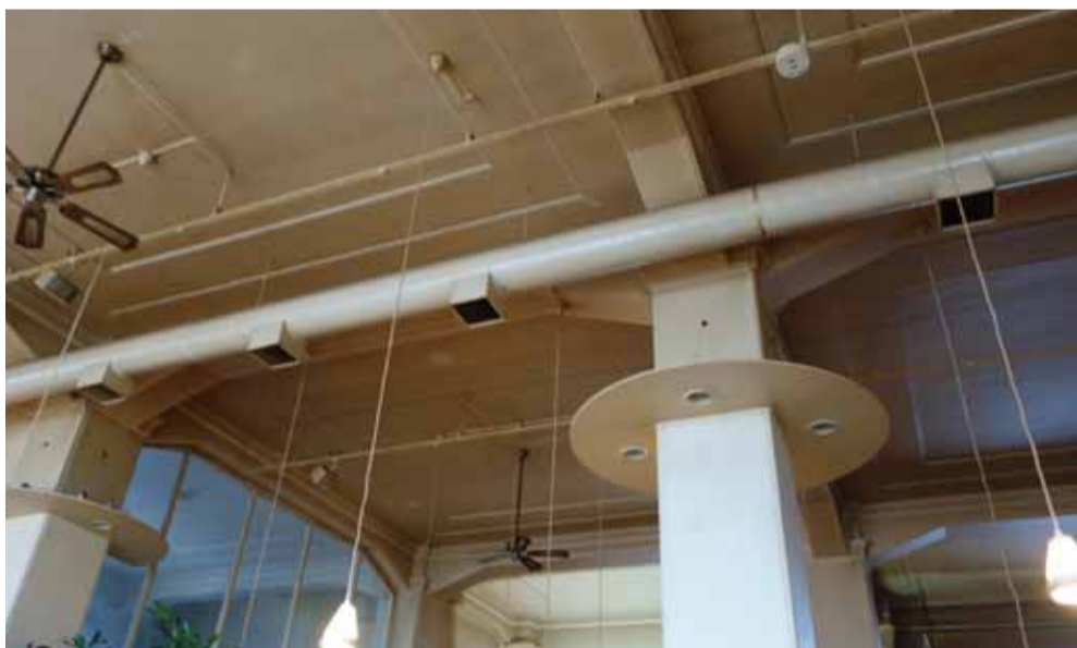
天井の高さを生かした配線とダクト