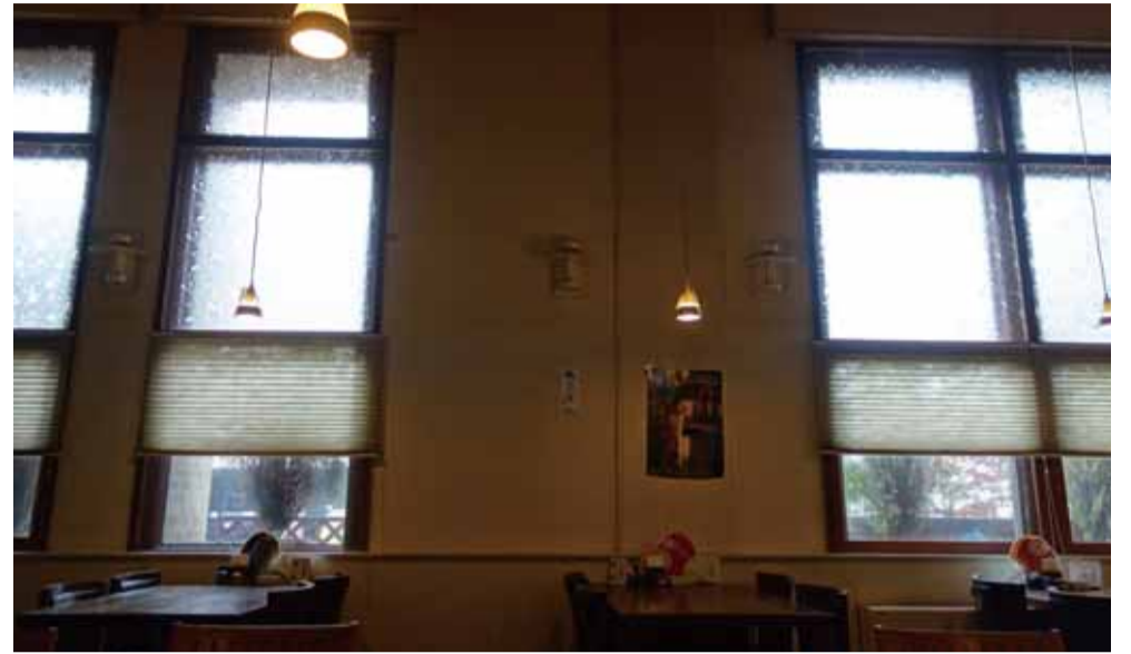
窓硝子サイズも特注