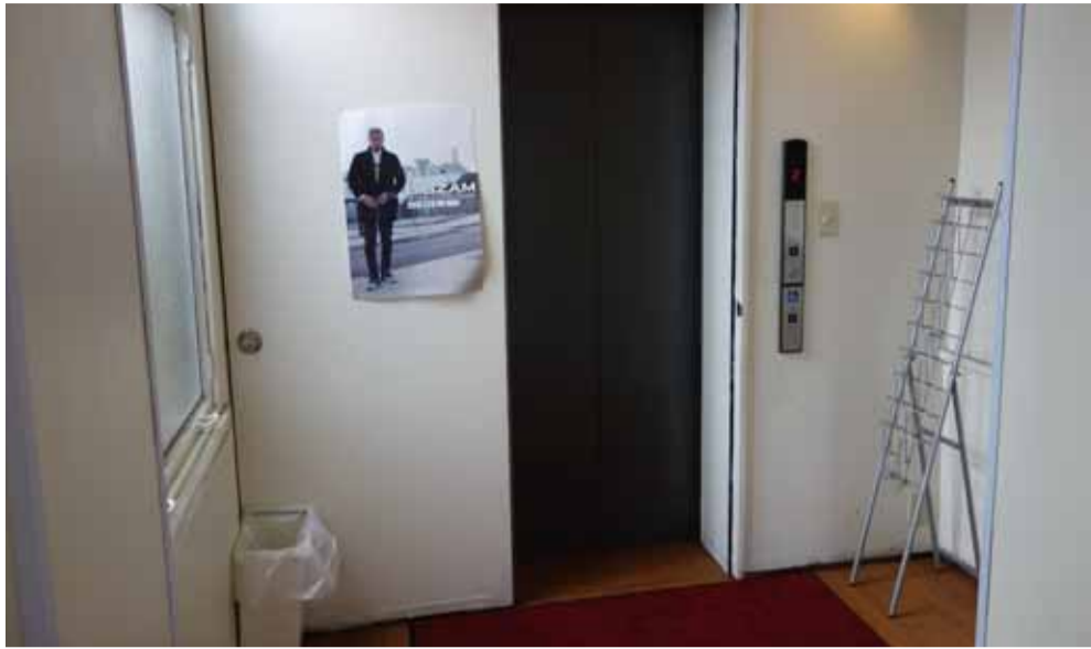
エレベーター新設