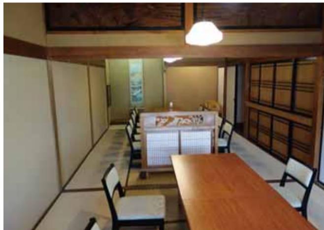
欄間と押し入れを生かした個室