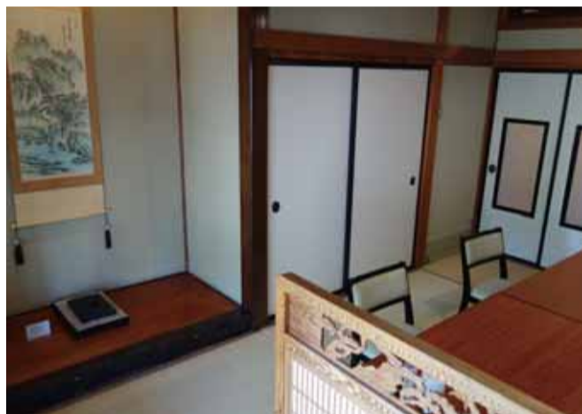
床の間のある個室