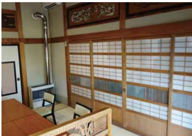
引き戸を生かした個室