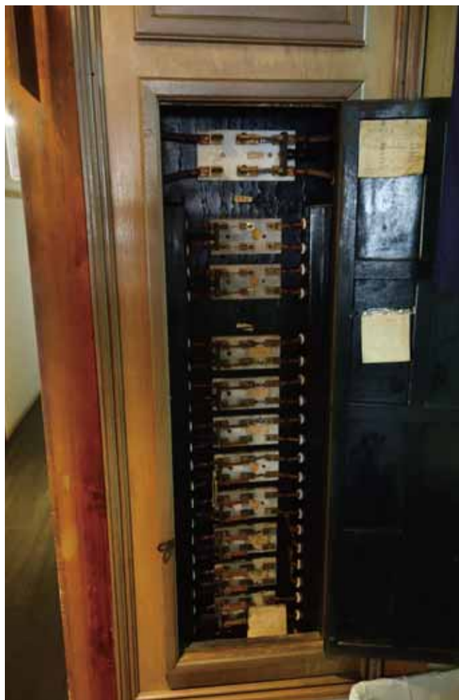
配電盤もディスプレイ