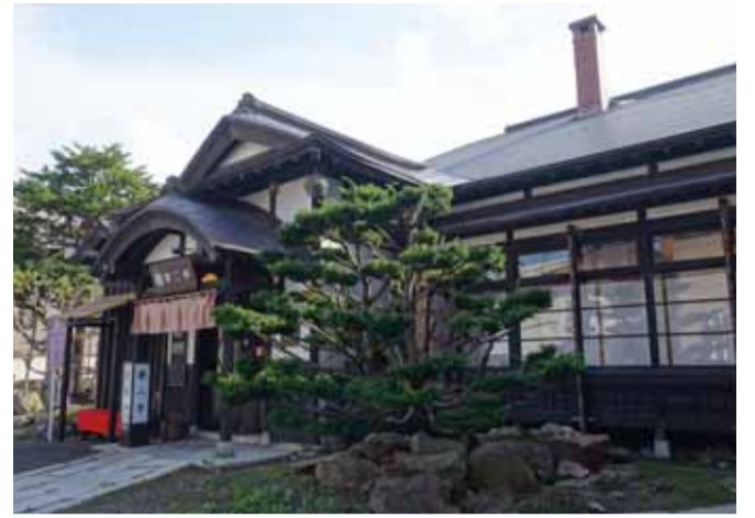
樹齢百余年のおんこの木