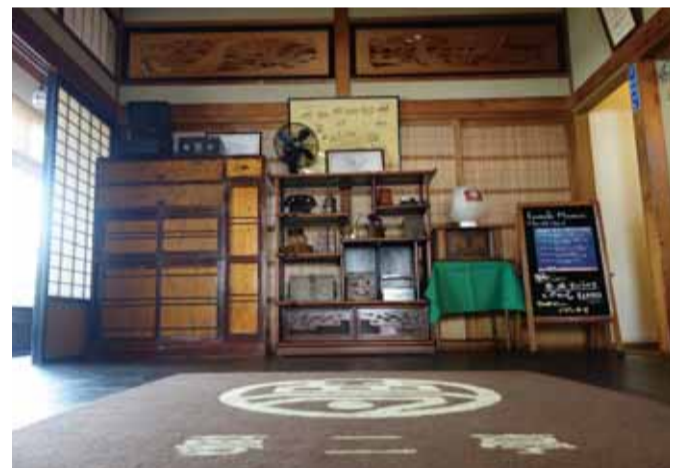
玄関でのお出迎え