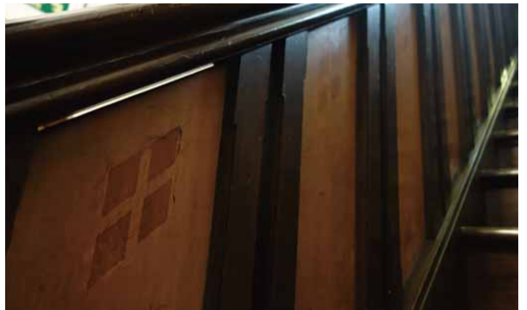
階段 手摺側壁板には菱形象嵌が施され幾何学模様