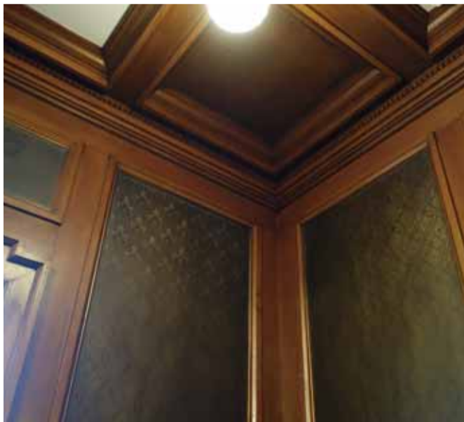
応接室 井桁の格縁天井