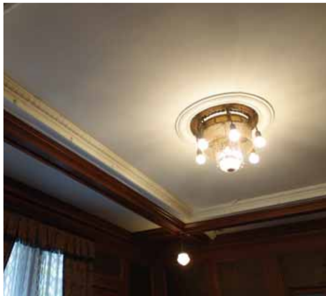
応接室 台輪とシャンデリア