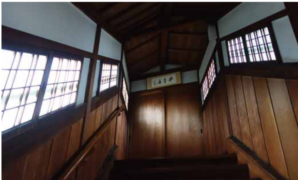
仏間へ通じる廊下は、廊下の形状、窓枠、棧、階段が全て斜め