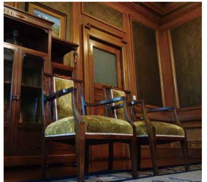
応接室 壁はミズナラ材の額縁飾り