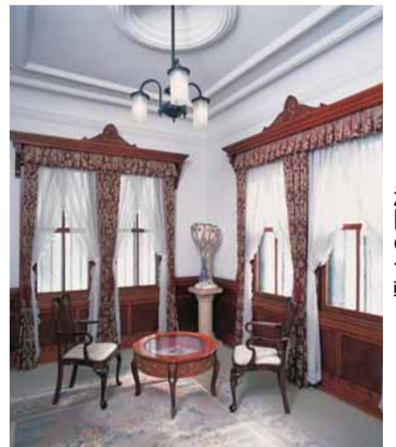
洋間の台輪