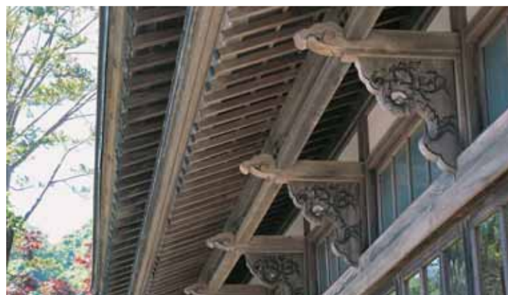
軒下の彫刻