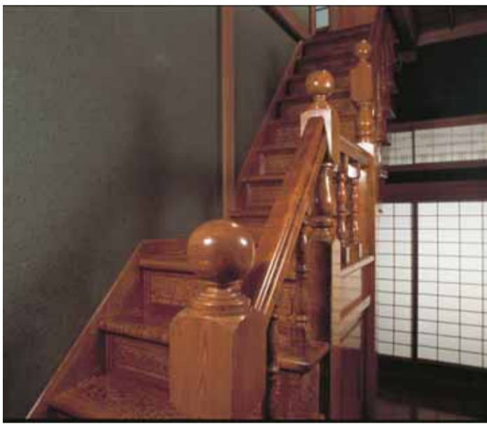
木目の美しい、たも材の階段