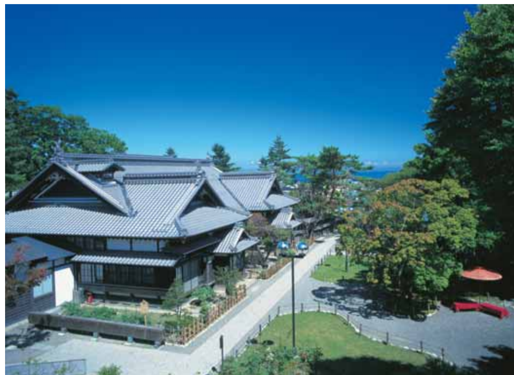
北の美術豪邸、旧青山別邸 現在の価格に換算して総工費35億円といわれる豪邸