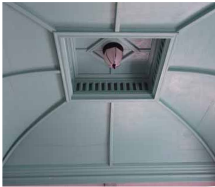
一枚板を蒸して曲げた風呂の天井