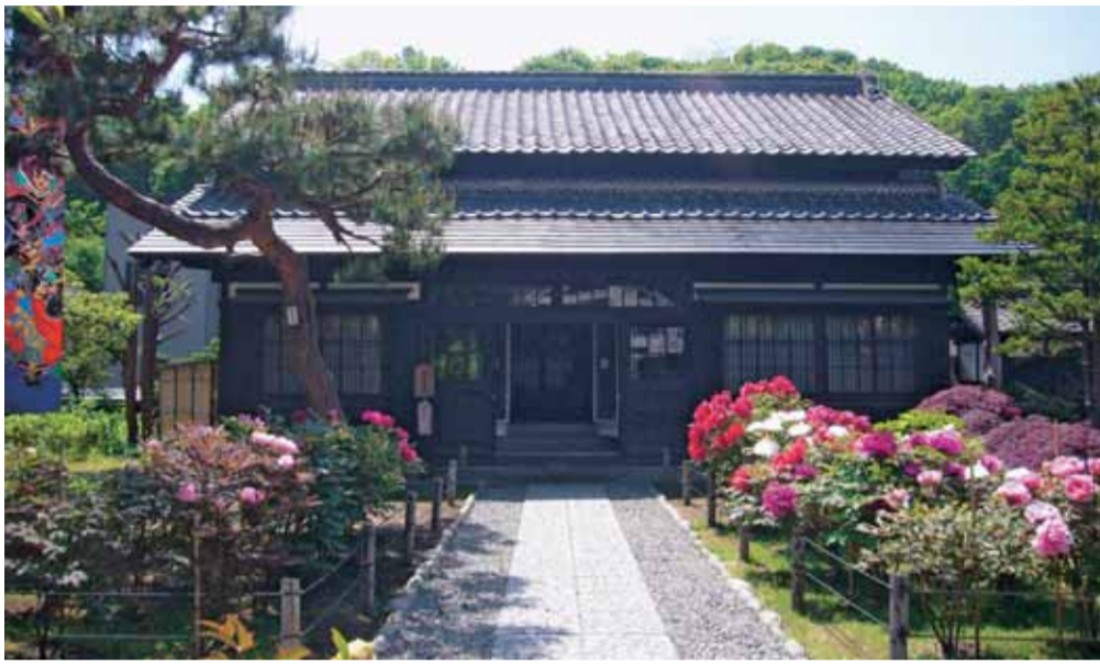
文庫蔵 外観