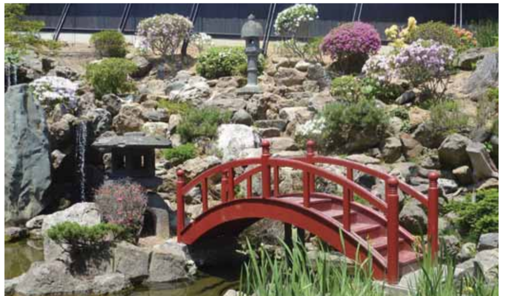
滝とつつじの庭園