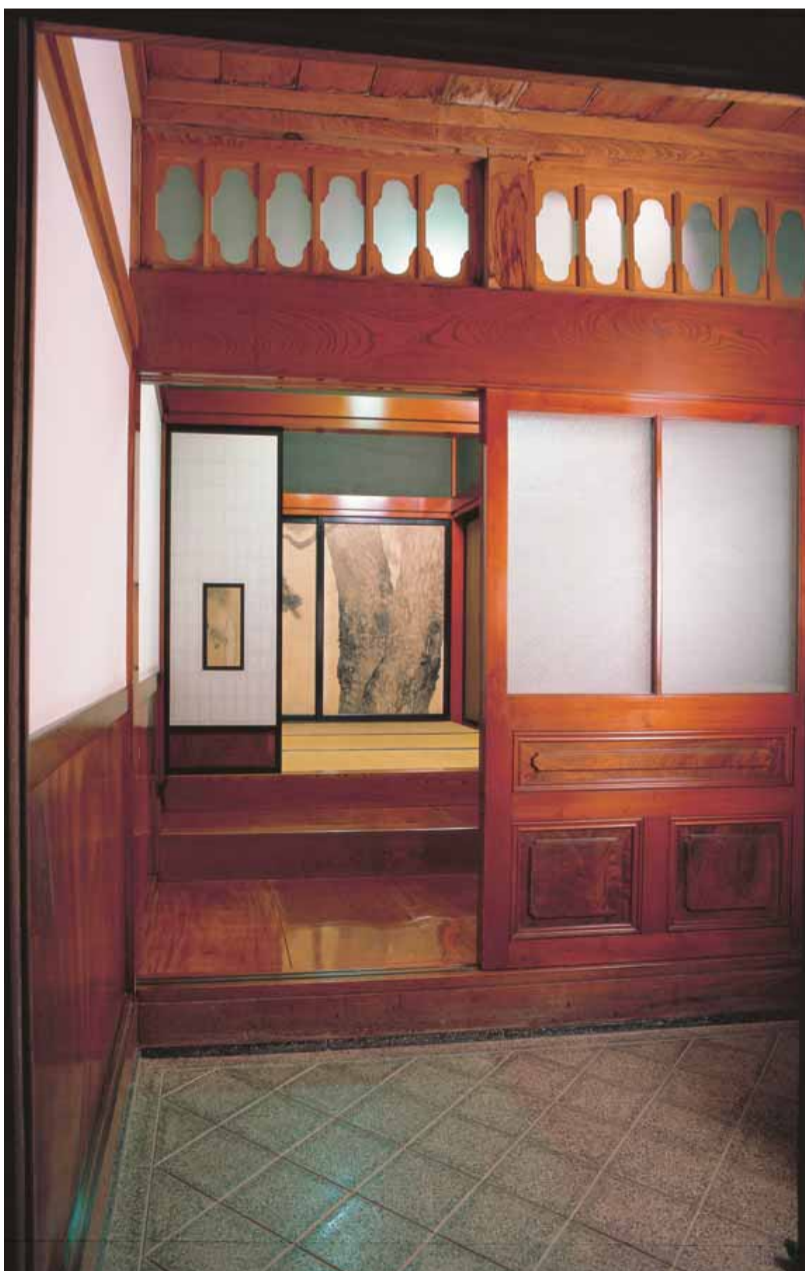
客用大玄関 襖絵「黒松」