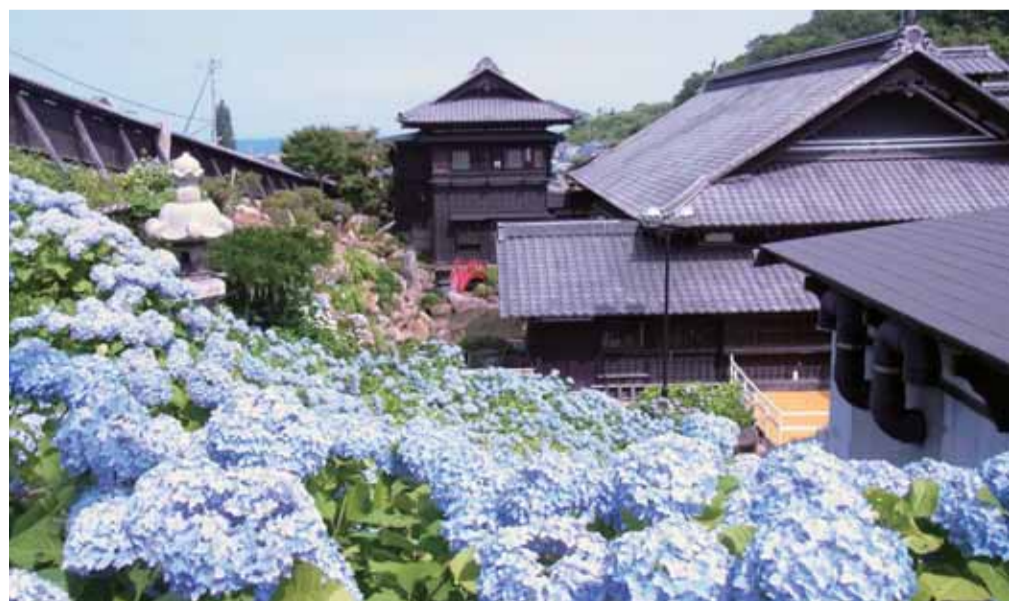
海を望むあじさい庭園