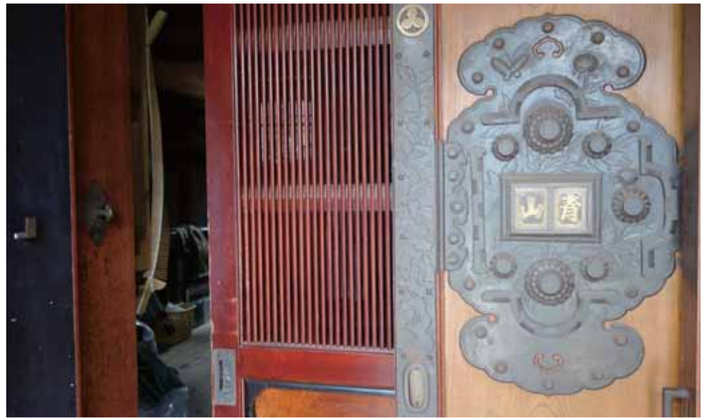
文庫蔵と錠の意匠